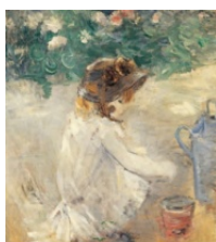
Monet, Les Pâtés de sable

Les années 80 au Centre Pompidou, du 24 février au 23 mai 2016